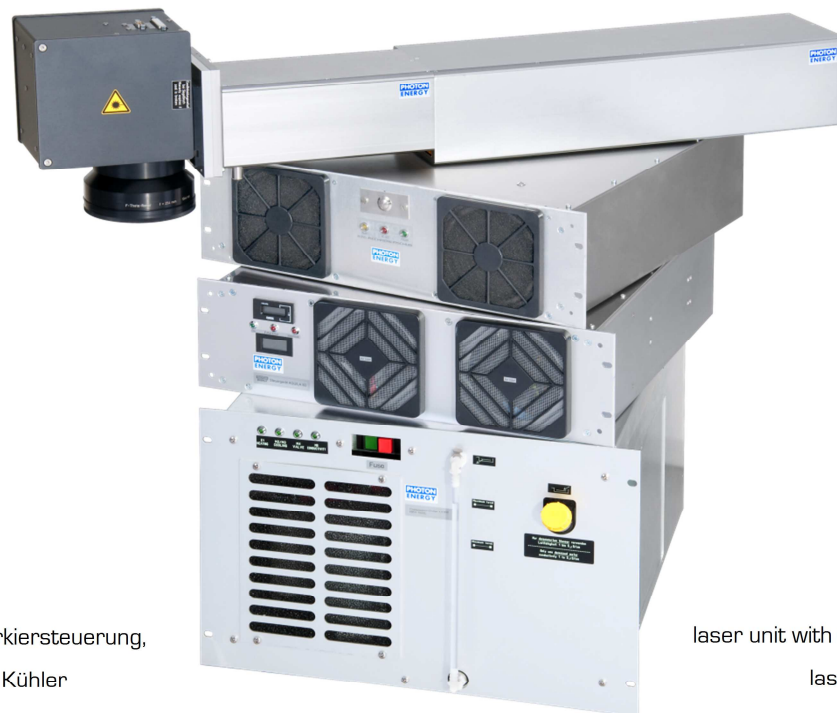
AQUILA Mark 200:

*3 weitere Linsen bzw. Felderößen auf Anfrage | additional lenses and field sizes on inquiry