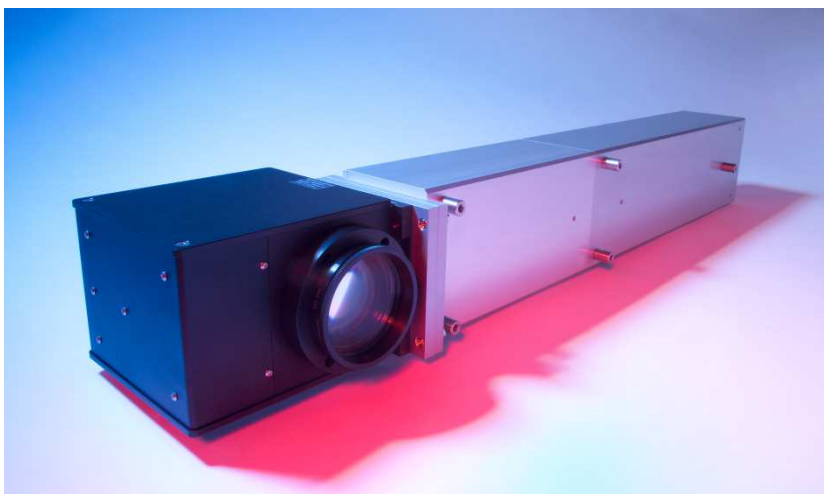
Lasereinheit AQUILA 120 (gerade Strahlführung)