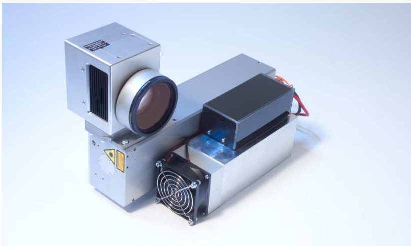
Lasereinheit LEO 8 (gewinkelte Strahlführung)