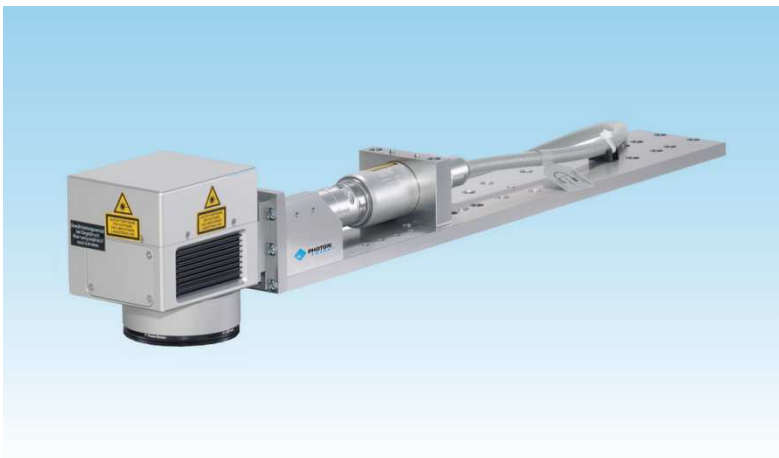
Lasereinheit FIBER 20 (gerade Strahlführung)